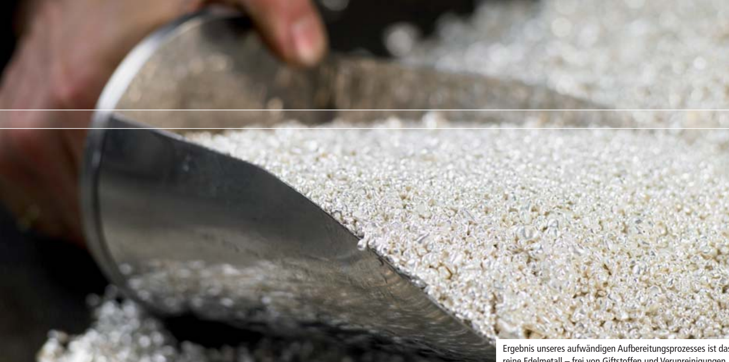
Ergebnis unseres aufwändigen Aufbereitungsprozesses ist das reine Edelmetall – frei von Giftstoffen und Verunreinigungen.