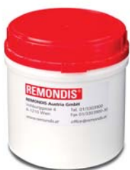
0,5-Liter-Spezialbehälter mit Desinfektionsmittel-Füllung für extrahierte Zähne.

Wenn Sie mehr über unsere Leistungen erfahren wollen, rufen Sie uns einfach an: ➔ +43 1 3303900, oder senden Sie eine E-Mail an ➔ office@remondis.at