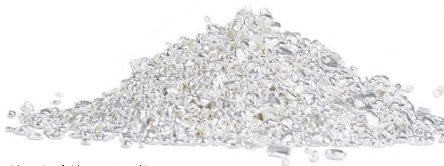
Verzichten Sie auf nichts. REMONDIS bietet Ihnen nicht nur stabile Entsorgungskonditionen, sondern auch detaillierte Abrechnungen.