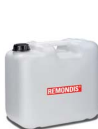
20-Liter-Kanister für Fotochemikalien.