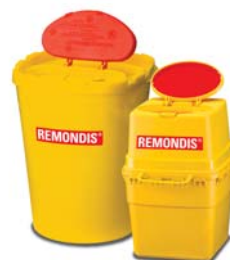
2-, 3-, 4- und 7-Liter-SafetyBoxen für infektiöse Abfälle und Abfälle mit Verletzungsgefahr.