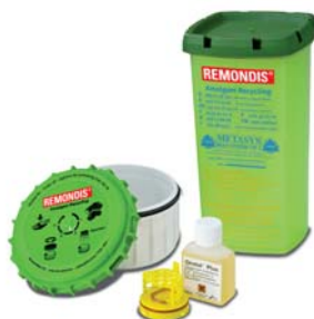
Wir liefern hochwertige Amalgamabscheider der Marken Dürr, Metasys und Sirona/Siemens.