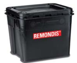
30-Liter-SafetyBoxen für infektiöse Abfälle und Abfälle mit Verletzungsgefahr.