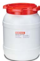
6-Liter-Spezialbehälter mit Quecksilberabsorber für amalgamhaltige Abfälle.